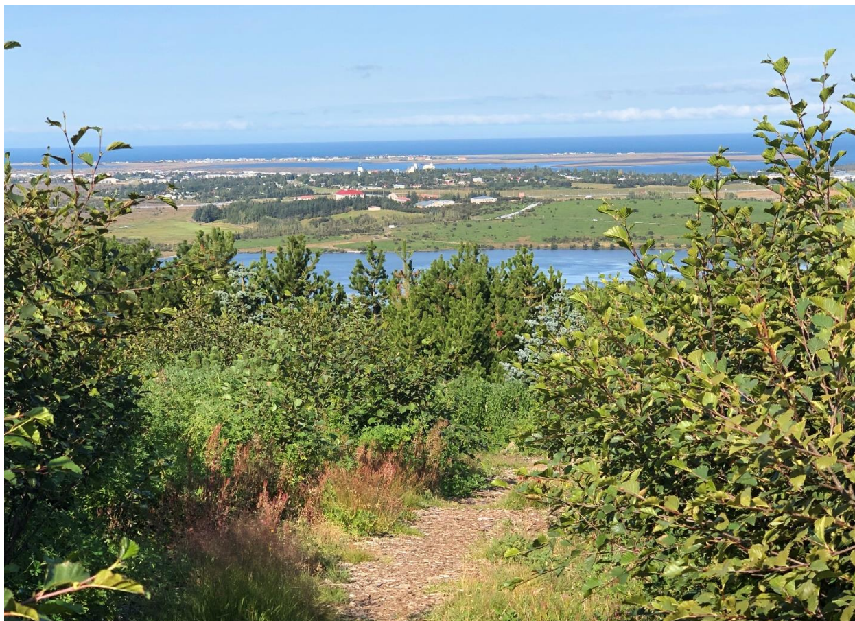
Útsýni ofan af Sandahlíð

Skógræktarsvæði félagsins eru; Smalaholt og Sandahlíð en þau liggja norðan og austan megin að friðlandi Vífilsstaðavatns svo og Tjarnholt og Hádegisholt sem eru upp af Urriðavatni. Félagið var áður með ræktun í Leirdal við Lönguhlíð sem var tekinn undir þjóðlendur. Einnig er félagið að rækta jólatré í reit í Brynjudal í Hvalfirði. Þá hefur félagið yfir að ráða aðstöðu austast í landi Vífilsstaða fyrir plöntur og vinnuskúr fyrir verkfæri.