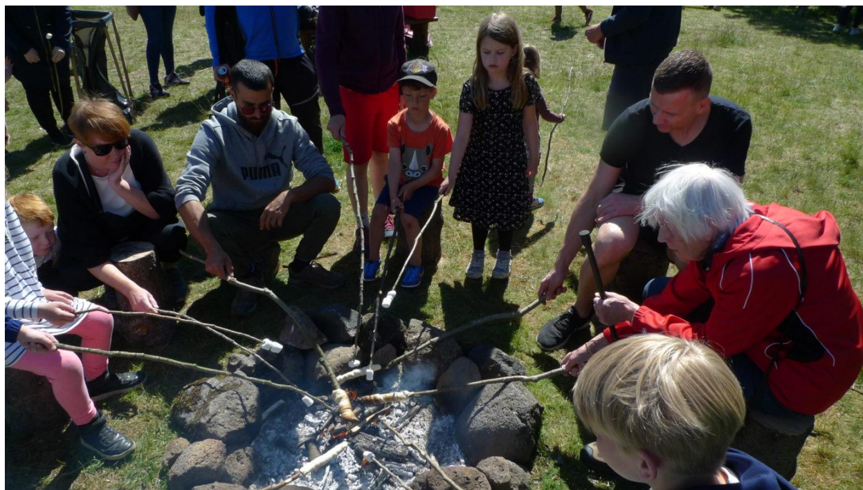
Skógardagurinn „Líf í lundi“ í Sandahlíð

Starfsskýrsla þessi nær til tímabilsins 1. sept. 2018 til 31. ágúst 2019