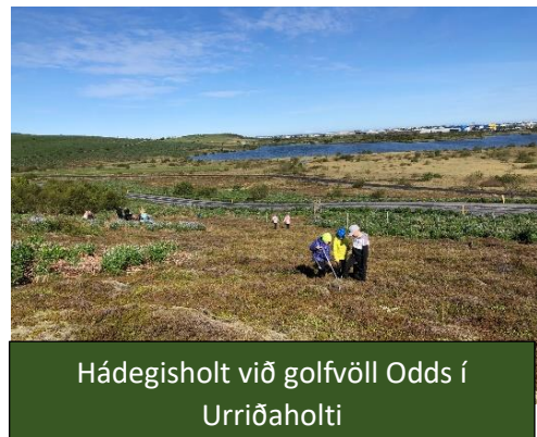
Hádegisholt við golfvöll Odds í Urriðaholti

Skógræktarfélagið hefur aflað leyfa fyrir þessi svæði hvert um sig, en er yfirleitt ekki með formlega undirritaða samninga.