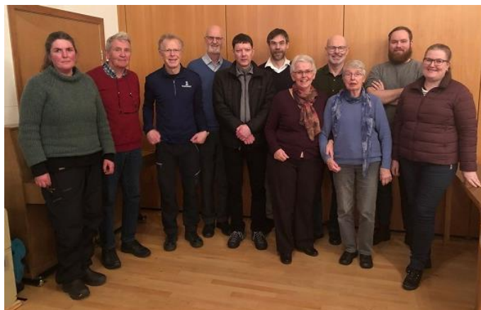
Stjórn félagsins - frá aðalfundi 2019